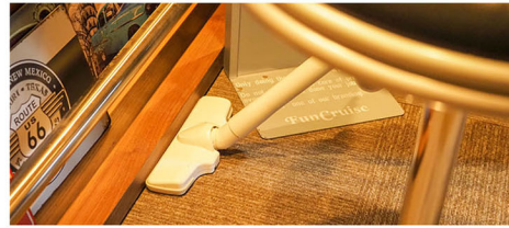
床上的物を動かさなくて済むため、心理面の億劫さがなくなり時間短縮も図れるなど、小さなヘッドのメリットは少なくない

ポイントだそう。確かに、店舗内に所狭しと什器や資機材を置いていたり、ブロワーを頻繁に使用したりするディテリングショップならではのメリットといえるかもしれない。