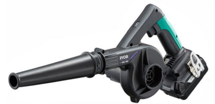
充電式ブロワー「BBL-180」と共用可能なバッテリー