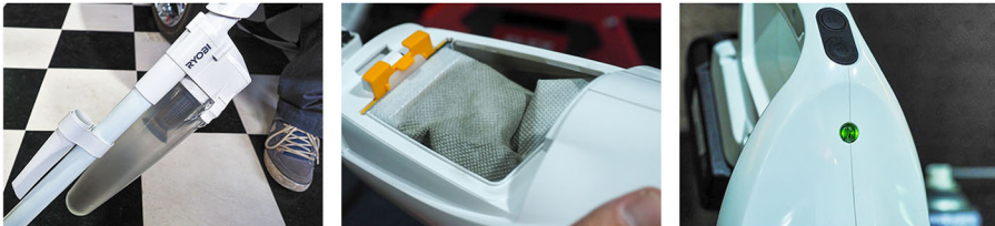
サイクロンとダストバッグの2重構造で排気もクリーンに。清掃の成果が目に見えるサイクロン式ユニットは心理的な満足感にもつながる(写真左・中)、電池残量を知らせるランプ。弱で45分、強でも20分と十分な連続使用時間を誇る(写真右)

そんな中、1つのソリューションになり得るのが、コードレスクリーナーだ。11月に新発売される京セラインダストリアルツールの充電式クリーナー「BHC-180L5」は、18Vの電圧とブラシレスモーターにより、同クラストップの吸込仕事率90Wを実現。従来モデル比でバッテリーの駆動時間も延びて、ハードな環境のディテリングショップでも優れた使い勝手を発揮する。