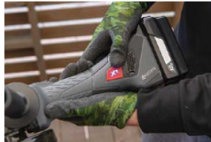
本体の側面についたボタンで、回転数を3000、6000、8000min -1 と3段階に切り替え可能