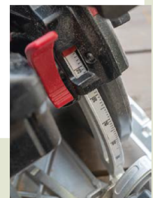
本体についた目盛で、チップソーの出幅を定規をあてずに調整可能