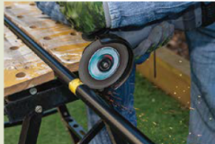
撮影時は30mm径のパイプを金属切断砥石でカット。ハンドルで本体をしっかり保持できる