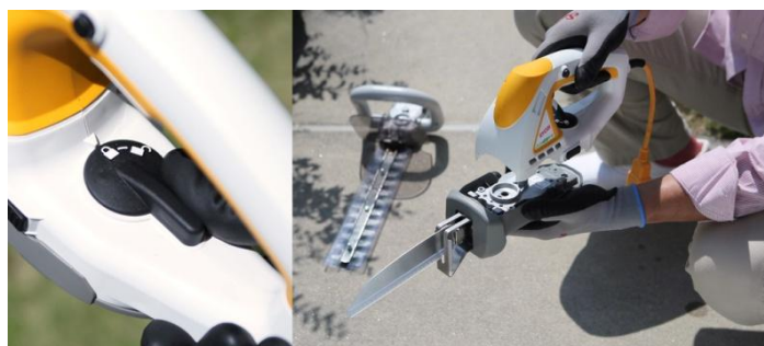
レバーを回すだけで、取り付けも取り外しもラクラク！

ユニットの取り付けには、特別な工具は不要です。本体ユニットのレバーを回すだけで、スムーズにワンタッチで着脱が可能です。