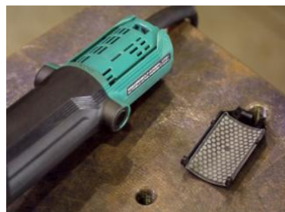
フィルターは取り外し可能で、溜まった粉じんの除去も簡単。

モーター熱を冷却するための風窓に、「防じんフィルター」を装着しています。0.161mm目のメッシュフィルターにより、通気性を損なうことなく、鉄粉や小石など故障の原因となる粉じんの侵入を防止。粉じんによるモーターへの影響を低減します。