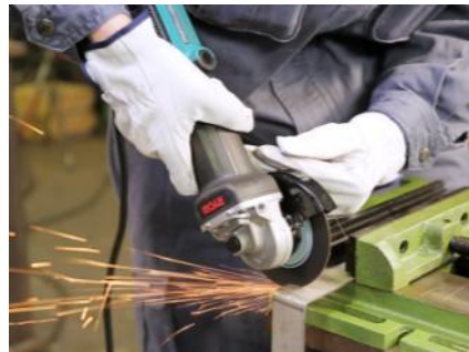
負荷の高い研削や切断作業に最適。