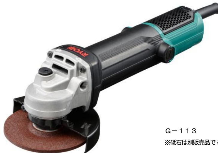
G-113 ※砥石は別販売品です。

金属製品や輸送用製品などの製造現場において金属の研削・研磨・切断、溶接痕除去やバリ取り作業にはディスクグラインダーが使われています。製造現場の生産効率向上が進む中で、研削・研磨作業にも操作性や耐久性、安全性、切削性の向上などさまざまな要件が求められています。