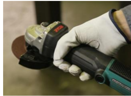
しっかりと握り込める52mmの握り径。

※1 握り径52mm： 砥石外径100mmのディスクグラインダーにおいて（当社調べ）