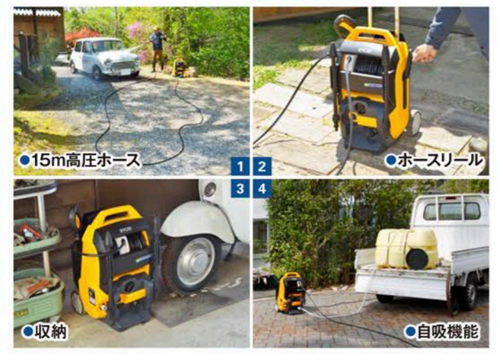
●15m高圧ホース ●ホースリール ●収納 ●自吸機能 ●伸縮ハンドル&ゴム車輪

1 高圧ホースはソフトタイプの15m。広範囲をカバーできる。2 本体にすっきり収納できる折りたたみ式ハンドルを回すだけで、15mの高圧ホースをキレイに巻き取ることができるホースリールを搭載。3 15mの高圧ホースやガン、ハンドル類も本体内にすっきり収まる省スペース設計。4 溜め水を利用できる自吸機能付き。自吸は呼び水が不要で簡単に吸水できる「エア抜きバルブ」を装備。