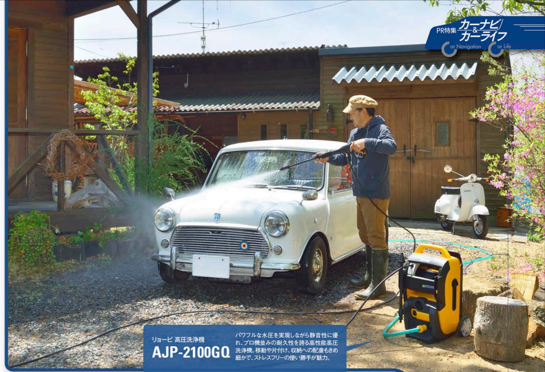
リョービ 高圧洗浄機 AJP-2100GQ

移動時に力を発揮するのが伸縮ハンドルとゴム車輪。伸ばしたハンドルを片手で引いて、キャリーバッグのようにラクに移動できる。車輪径が大きいので、多少のデコボコも気にせず移動可能。収納時にはハンドルを縮めれば、スペースもとらない。