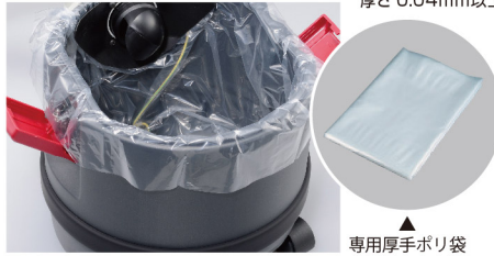
専用厚手ポリ袋 10枚付

集めたごみを袋ごと捨てられるポリ袋10枚付。 市販のポリ袋*も使用できます。*45L以上 厚さ0.04mm以上