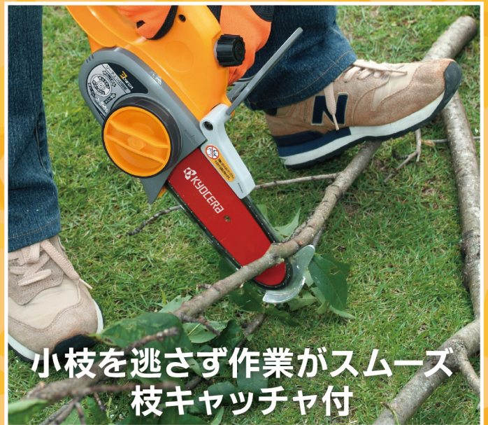
小枝を逃さず作業がスムーズ 枝キャッチャ付