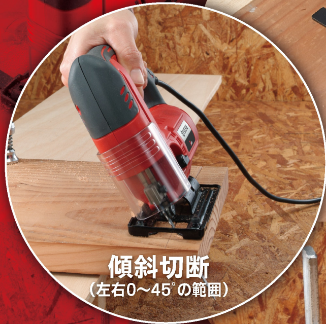
傾斜切断 (左右0~45°の範囲)