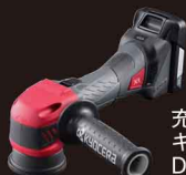
充電式 ギヤアクションポリッシャー DPEG11XR