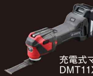
充電式マルチツール DMT11XR