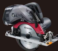
充電式集じん兼用丸ノコ DNW11XR