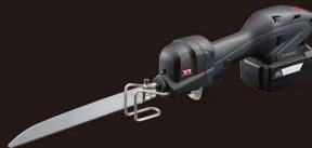
充電式小型レシプロソー DRJ11XR