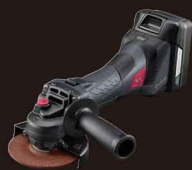
充電式ディスクグラインダー DG11XR