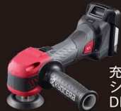
充電式 シングルアクションポリッシャー DPE11XR