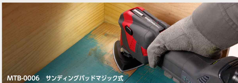
MTB-0006 サンディングパッドマジック式