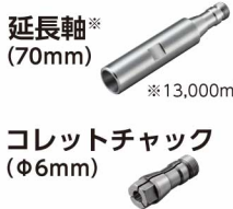
延長軸* (70mm) ※13,000min -1 以下での使用をお勧めします。 コレットチャック (Φ6mm)